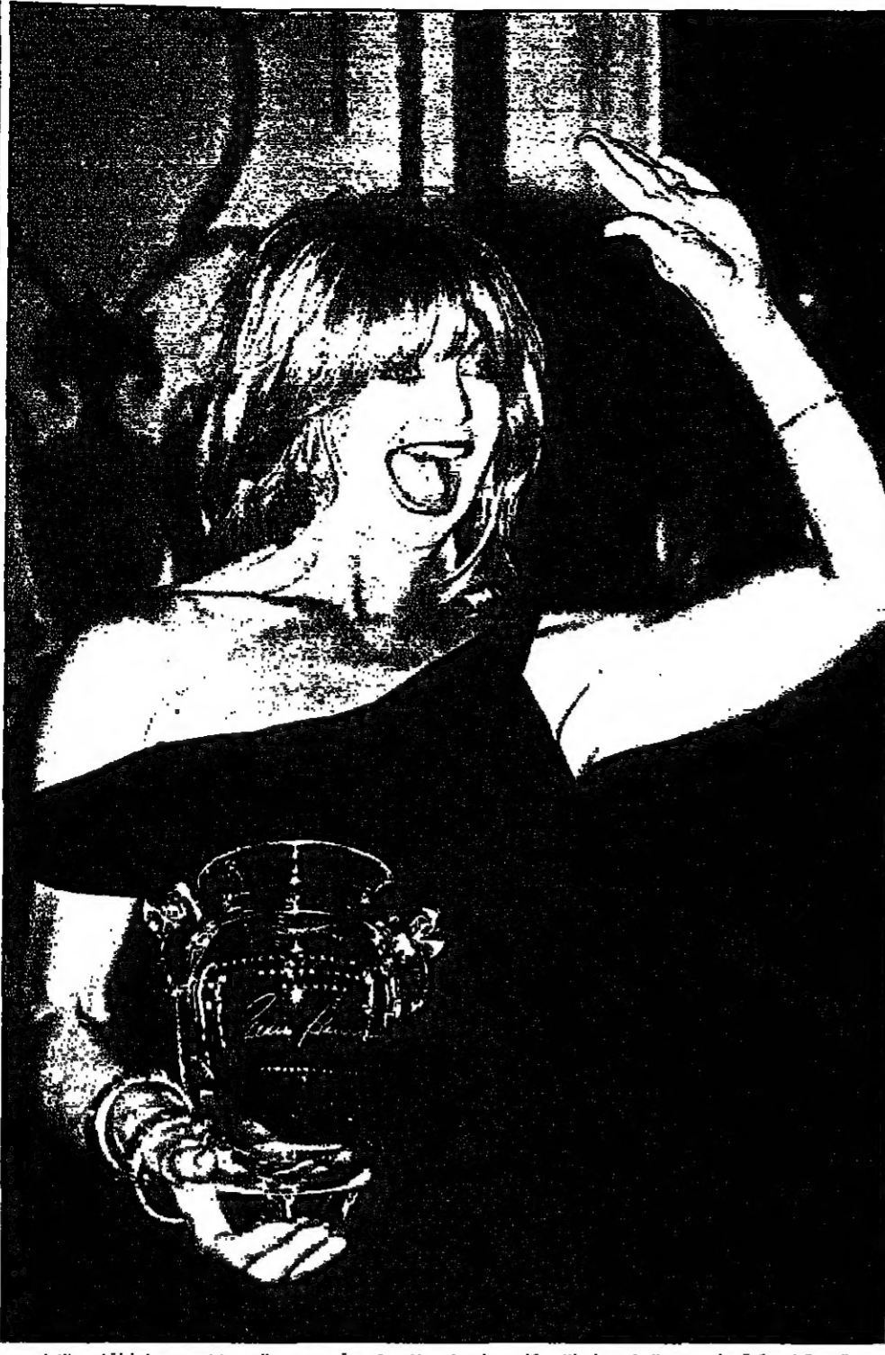
التجعة الأمريكية فولدي هون الحائزة على الأوسكار حصلت على جائزة تقيرية من متحف السينما في نيويورك ليلة أمس الأول